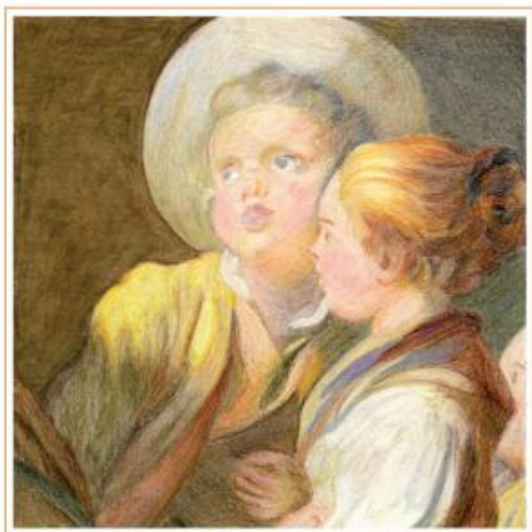
TRJGOMRD - Camillo Corot: Chiara Re Corboyot