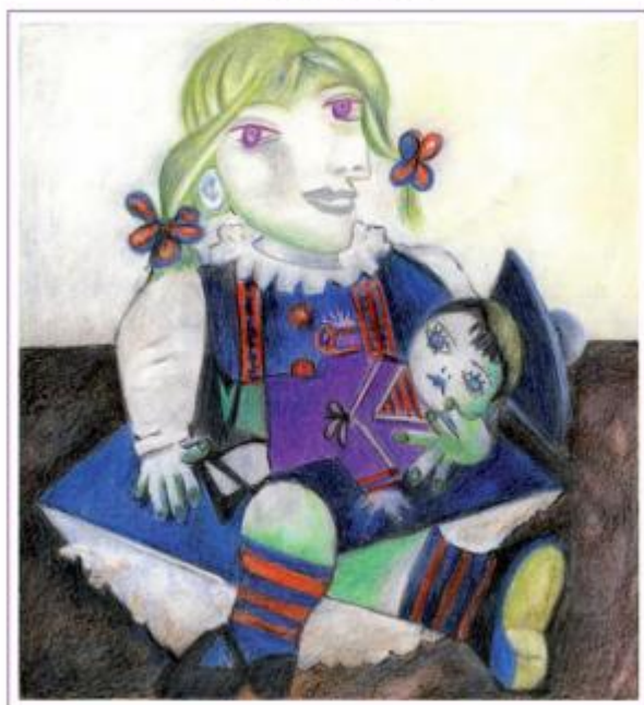
PICASSO - Andrèa Merito, Mossimbrano Rendena