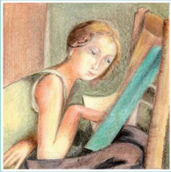
BALTHUS - Orla Gjeløft, Cinema, Orliccazi, FedERICA MISTONI