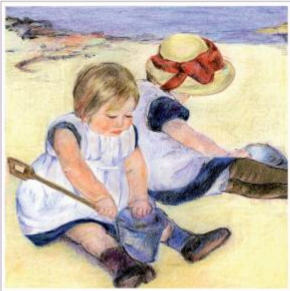
CASSATT - Orla Colan, ATTORA ANGI