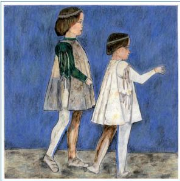
MNCOM - Alice Invernizzi, Chiara Serbelli