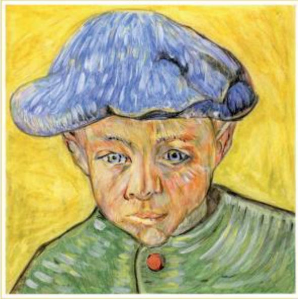
J.M.W. TURNER - A young boy in a blue cap