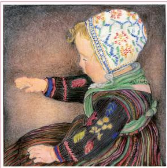
UMBERTO BOCCIONI - The Old Woman